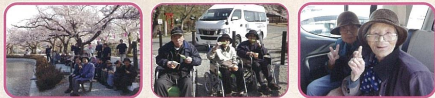
東根市、堂の前公園は桜の名所でもあります。ご利用者、職員とともに満開の桜を楽しみます。公園で桜を見ながらのお団子は格別楽しんでいただきました。