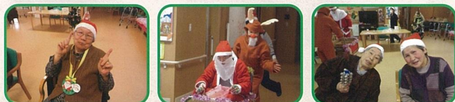
職員がサンタクロースとトナカイに扮してクリスマスプレゼントをお配りします。クリスマス帽子を被ってクリスマスソングを歌いメリークリスマスの雰囲気を楽しみます。