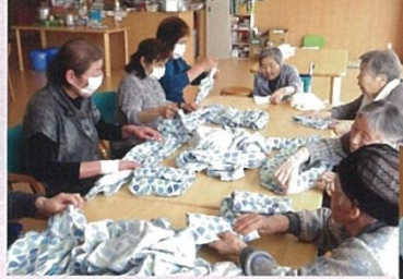
尾花沢市保健委員様