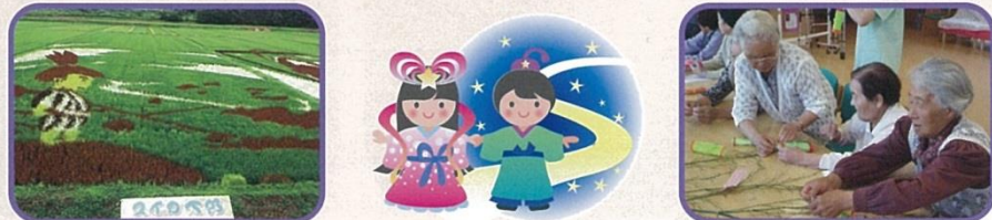
柳に短冊を書き、飾り付けを楽しみます。名木沢にある田んぼアートを訪れ風景や趣向を凝らしたアートを楽しめました。