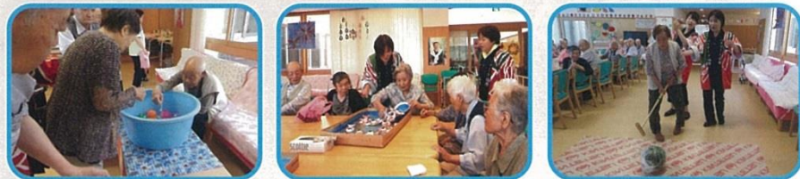
夏祭りを懐かしみながら風船すくい、金魚すくい、スイカ割りなどで遊びました。