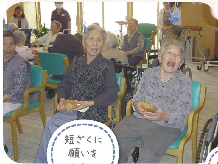
短ざくに 願いを こめて