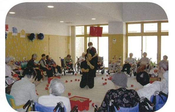
スイカ 割れたかな〜♪