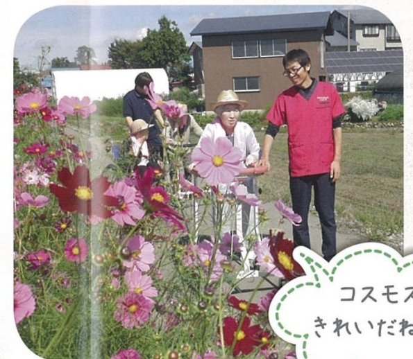
コスモス きれいだね♪